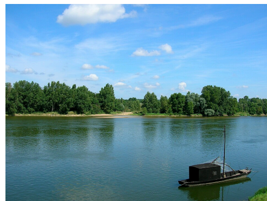
Μονάδα επεξεργασίας λυμάτων Mancasale στο Reggio (αριστερά) και στον Λίγηρα στο Bréhémont (δεξιά)