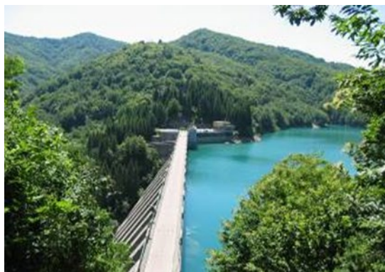
Λίμνη Brugnato, Torriglia (GE) – Ιταλία © IREN

Οι πηγές παροχής είναι υδροφόροι ταμιευτήρες (υπόγεια ύδατα), χείμαρροι και ποτάμια, φυσικές λίμνες, ή τεχνητές που δημιουργήθηκαν από φράγματα (μέσω το οποίων, χάρη στις υψομετρικές διαφορές, μπορεί επίσης να παραχθεί και ηλεκτρική ενέργεια). Το νερό μας μπορεί να απολυμανθεί ή να υποστεί επεξεργασίες καθαρισμού, κάποιες φορές απλές, άλλες φορές σύνθετες, σε συνάρτηση με την προέλευση και την ποιότητα του νερού. Στη συνέχεια, διοχετεύεται σε ένα σύστημα υπόγειων αγωγών, όπου μπορεί να αποθηκευτεί σε δεξαμενές, συχνά σε ψηλό σημείο ώστε να διασφαλιστεί επαρκής πίεση. Τελικά, φθάνει στα σπίτια μας μέσα από ένα πυκνό δίκτυο διανομής.