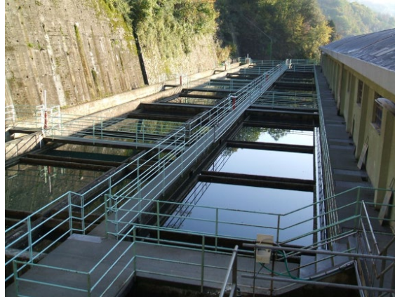
Επεξεργασία πόσιμου νερού στη Γένοβα

μέσω μεμβρανών που φέρουν μικροσκοπικούς πόρους οι οποίοι μπλοκάρουν τους μικροοργανισμούς.